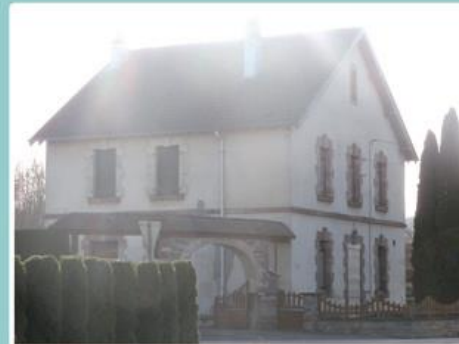
L'ancienne école de la Gabiotte (ou de la Motte) dans son état actuel (Propriété privée).