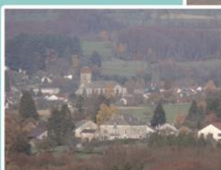
Zoom sur La Germenain et Fougerolles-Centre depuis le bois surplombant la RN 57.