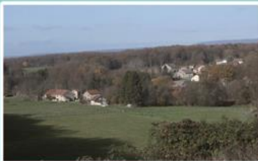
Vue sur une partie de la Motte depuis la RN 57.

Le nom de La Motte vient de la nature du relief (motte, monticule), ses habitations sont principalement construites sur le versant fougerollais. Sur le cadastre, la Motte de Fontaine est nommée « Hameau de la Motte », la Motte de Fougerolles « Grange de la Motte ». Sur le ruisseau de Rôge, un moulin à millet est signalé en 1747. Il servait aussi à « fouler » le droguet (tissu de laine et de chanvre), et la bure (étoffe de laine). Un autre moulin a existé dans les mêmes lieux, devenu par la suite la scierie Despoulain, non loin, mais sur la Commune de Saint-Valbert (moulin Dormoy). Curieusement, contrairement au reste de la Commune, une seule manifestation de dévotion religieuse est présente dans tous ces secteurs, où une croix datée de 1839 est incluse dans une propriété privée.