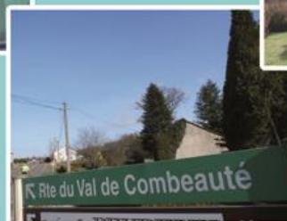
A la Gabiotte en venant de Luxeuil, bienvenue sur la route du Val de Combeauté !..

Remerciements : à l'A.D.E.F pour les documents photographiques anciens, à M. Gury pour ses renseignements sur le moulin à millet de la Motte.