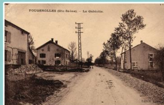
La Gabiotte autrefois...