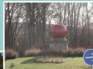
Le rond-point de la Cerise depuis 2013.