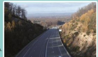
RN 57, entrée Sud de Fougerolles.