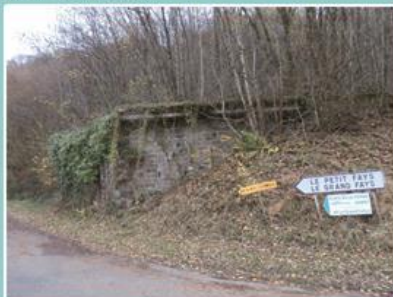
Pont sur le ruisseau des Cerisiers