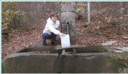
La Fontaine Servin dite « des Négociants » (fort appréciée ici par cette amatrice vosgienne...)