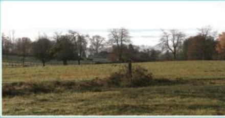
La vallée de la Combeauté dans la brume...