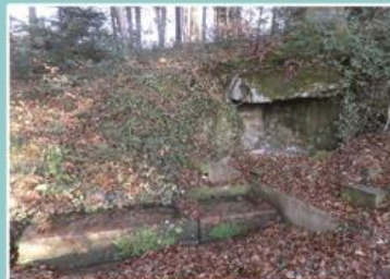
La Fontaine de Chez Jean Foué