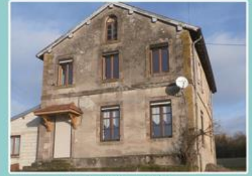
L'école du Grand-Fahys, aujourd'hui propriété privée