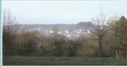
En apercevant La Vaivre...