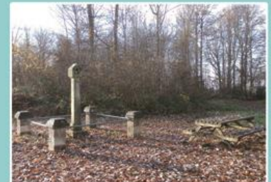
Le parking du Grand Foyard...