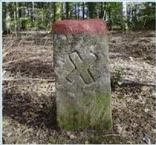
Borne de Saint-André (Bourgogne)

Le lieu-dit du Calvaire anciennement appelé les Côtés. Enfonçons-nous dans le bois du Fays, d'où nous pouvons voir les premières neiges arriver sur notre commune. A proximité du ru de Rôge en limite de Saint-Bresson existent des bornes anciennes datant de Louis XIV délimitant la Bourgogne Comté et la Lorraine.