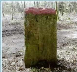
Croix d'Anjou (Lorraine)