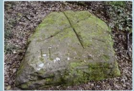
Et pas très loin la pierre de Transalmon qui comporte des gravures.