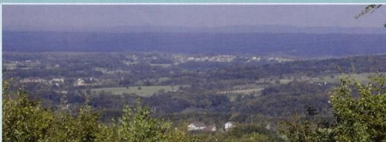
Borne aux 3 communes et Croslières - La Ramouse - La Vaivre