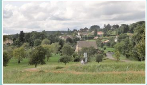
Vue sur le Petit-Fahys depuis la RN 57