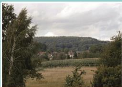
Vue sur le Prédurupt en allant aux Etangs du Crau