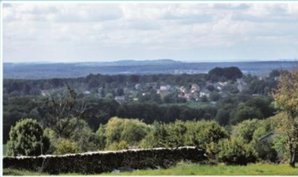
Vue sur La Vaivre, une partie de Fleurey-lès-Saint-Loup et au loin Montdoré depuis la route en direction du Grand-Fahys.