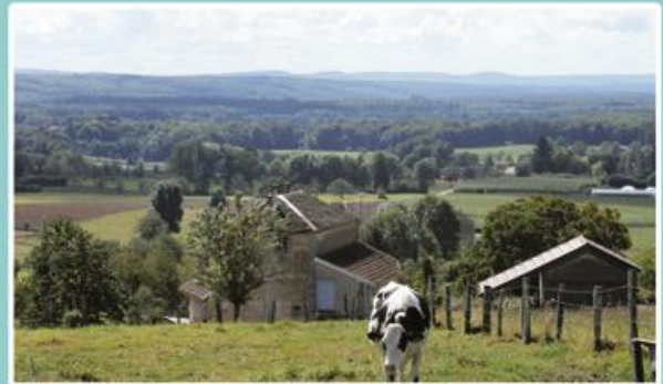
Le Petit-Fahys vous offre une vue allant du Calvaire, Blanzey, Les Granges, La Germenain, La Gabiotte, La Motte, Le Prédurupt, Fontaine-lès-Luxeuil (église), Hautevelle (église), Saint-Loup, jusqu'à Magnoncourt.

Le nom de Petit-Fahys vient du mot « Faye » qui désigne un lieu où les hêtres étaient abondants et remarquables avant les défrichements qui ont jalonné l'Histoire.