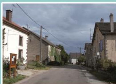
Le centre du Prédurupt