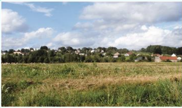
Vue sur le Petit-Fahys depuis la route du Prédurupt