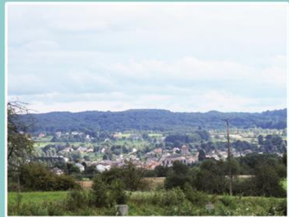
Vue sur Fougerolles et les Granges depuis le Haut-de-la-Beuille