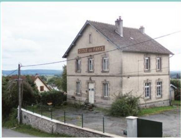
L'ancienne Ecole du Petit-Fahys (Propriété privée)